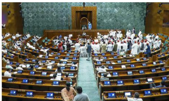
Opposition MPs troop to the Well of the House in the Lok Sabha during the Monsoon Session of Parliament on Monday.

Union Finance Minister Nirmala Sitharaman had introduced the previous version of the Bill in the Lok Sabha in February, following which it was sent to a Select Committee chaired by Baijayant Panda for a review. The Select Committee submitted its recommendations on July 21. Following this, the government on Friday withdrew the Bill to incorpo-