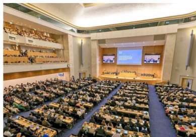
No consensus: Two coalitions have evolved over four sessions of the Intergovernmental Negotiating Committee in Geneva.

However, two broad coalitions have evolved over four sessions of the Intergovernmental Negotiating Committee (INC) on Plastic Pollution here – the High Ambition Coalition (HAC) chaired by Norway and Rwanda, consisting of nearly 80 countries, including members of the European Union (EU), and the Like Minded Countries