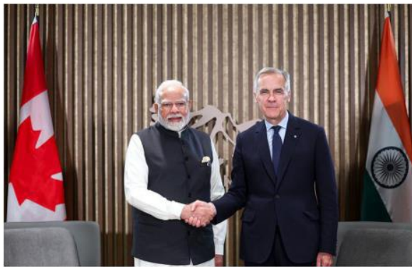
Prime Minister Narendra Modi meets Prime Minister of Canada Mark Carney on the sidelines of the G-7 Summit at Kananaskis.

"The Prime Ministers agreed to take calibrated steps to restore stability to this very important relationship. The first of these steps agreed upon was to