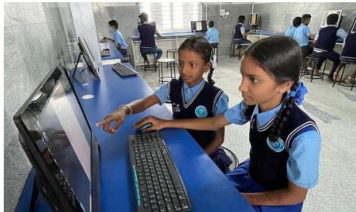
More scope: Twenty-four States & Union Territories improve scores, report says, but no States in the top scoring range. K. MURALI KUMAR

None of the States feature in the top scoring range of 761-1,000, which suggests that there is huge scope for improvement, Ministry officials said. The report shows that 24 States