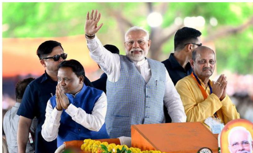
Celebrating a milestone: Narendra Modi greets supporters as he arrives at the Janata Maidan in Bhubaneswar on Friday to mark the anniversary of the BJP government in the State.

Dedicating and laying the foundation for 105 projects worth almost ₹19,000