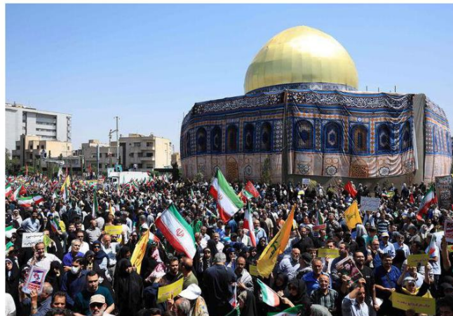
On the boil: Iranians gather for an anti-Israel rally next to a replica of the Dome of the Rock mosque in Tehran on Friday.

"The good result today is that we leave the room with the impression that the Iranian side is ready to further discuss all the important questions," said German Foreign Minister Johann Wadepuhl in a statement alongside his