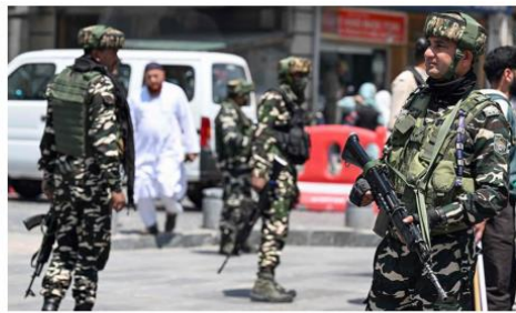
Troops stand guard at a market area in Srinagar on Monday.

China's military expenditure increased by 7% to an estimated $314 billion, marking three decades of consecutive growth, the study noted. China accounted for 50% of all mil-