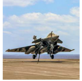
Deliveries are set to begin from mid-2028 and likely to be completed by 2030. DINAKAR PERI

The French Defence Minister was scheduled to vi-