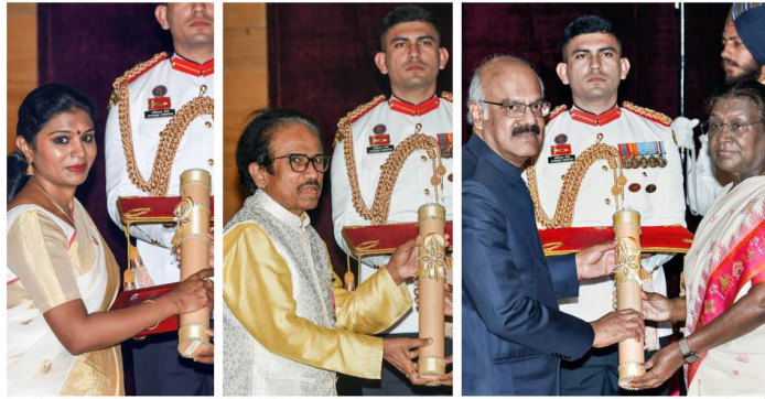
President Droupadi Murmu confers the Padma Vibhushan award on writer M.T. Vasudevan Nair (posthumous); violinist L. Subramaniam and Chairman of Asian Institute of Gastroenterology and AIG Hospitals D. Nageshwar Reddy at the Rashtrapati Bhavan on Monday.

Among the awardees, four received Padma Vibhushan, the second-highest civilian honour in the