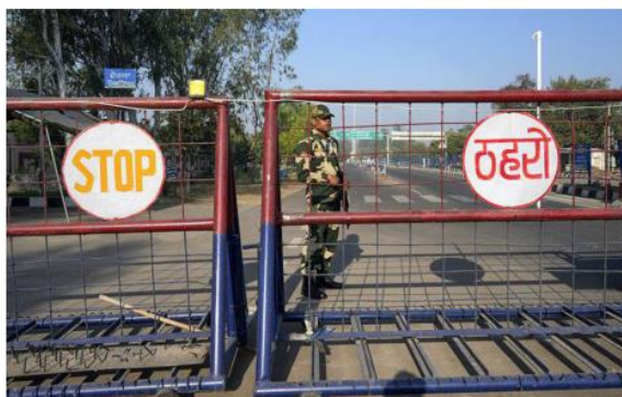
Security on the Attari-Wagah border on Monday. India has directly blamed the terror attack on "cross-border" linkages to Pakistan.

Chinese Foreign Minister Wang Yi had spoken to Pakistan's Deputy Prime Minister and Foreign Minister Ishaq Dar on Sunday, expressing support for what Mr. Wang called Pakistan's "resolute" action on terrorism. "As Pakistan's ironclad friend and