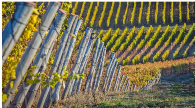
A grape vineyard in Moldova, 2017. Botrytis fungi infects grapes with the effect of concentrating the sugars and flavours in them.

In many well-studied ascomycetes fungi, eight ascospores are made in each ascus. All the nuclei of an individual ascospore are genetically identical. That is, they all have the same set of chromosomes. B. cinerea and S.