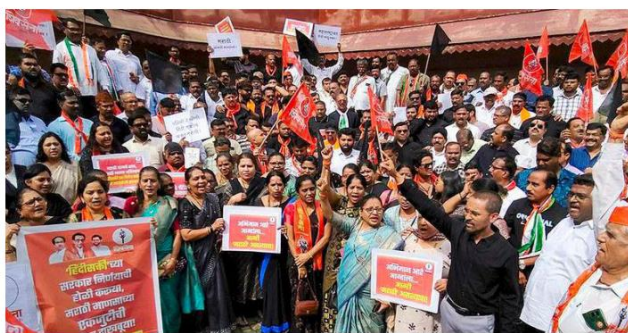
Word troubles: Shiv Sena (UBT) workers protest against the proposed three-language policy in Navi Mumbai, Maharashtra, on Sunday.

This policy will impact nearly 80 lakh primary students in the State Board's Marathi and English medium schools. The three-language formula is currently